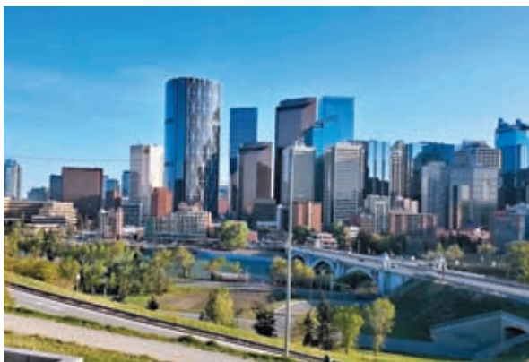
各地不斷興建房屋，但依然供不應求。

根據加拿大按揭及樓宇公司統計，全國需在2030年前興建多580萬間新房屋，才能解決供不應求問題。主要反對黨保守黨抨擊杜魯多上任8年以來一直無法解決住屋問題，不斷加重國民負擔。