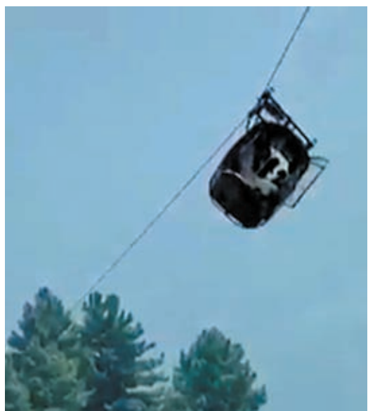
8人被斷纜索吊車(上圖)。軍方出動直升機，8人全部獲救(右圖紅圈示)。