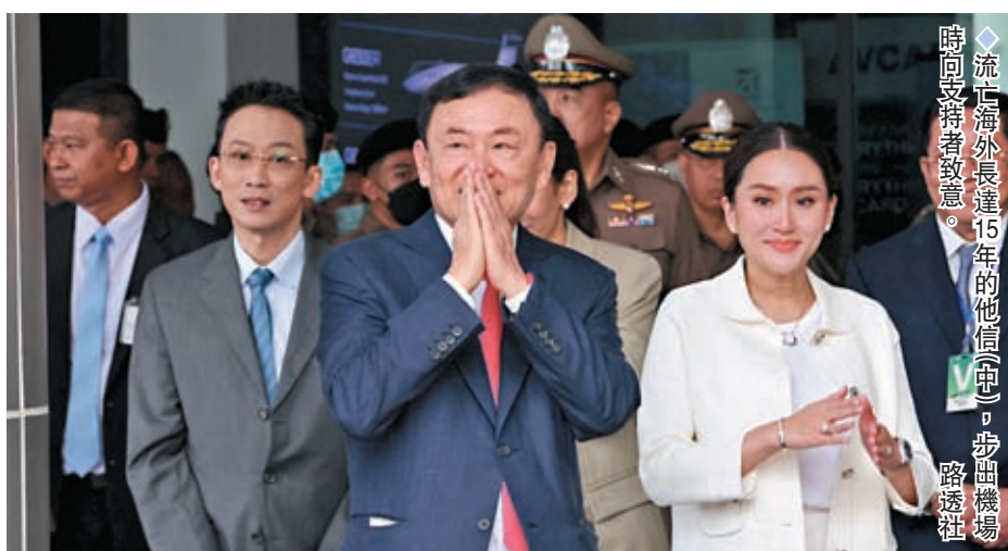
流亡海外長達15年的他信(中)，步回機場時向支持者致意。

香港文匯報訊 流亡海外長達15年的泰國前總理他信，22日在國會投票選出新總理同日回國。泰國最高法院隨即裁定他信3項罪名成立，判處他入獄8年。不過分析指他信主動回國「自首」，相信是由於跟他關係緊密、推舉今次唯一總理候選人的為泰黨，與同意支持該黨組閣的軍方勢力達成政治協議。加上為泰黨推舉的候選人斯雷塔成功當選，泰國政治環境可暫時穩定，預料他信或很快重獲自由。